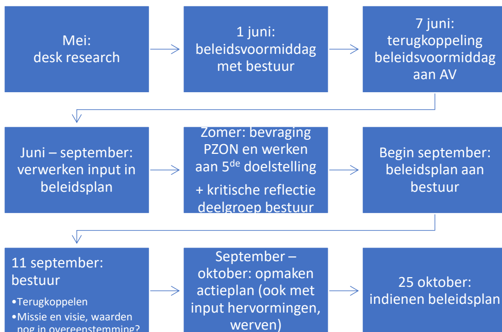
Figuur 1: schematisch overzicht beleidsplanningsproces

Bij dit proces deden we beroep op het ondersteuningsaanbod van VIVEL.