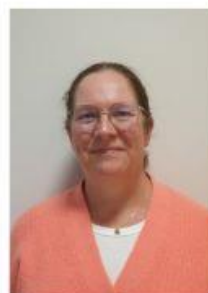
Joke Vervenne Administratie