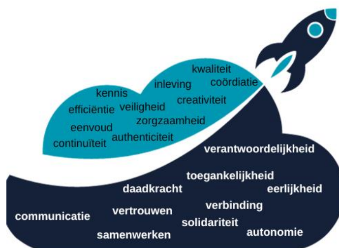
Figuur 1: Waardenwolk 2.0

Onze oorspronkelijke waardenwolk werd in 2023 herbekeken. Er werd geëvalueerd of deze waarden nog steeds in overeenstemming zijn met wie we zijn en waar we voor staan, rekening houdende met de geleerde lessen uit de coronacrisis en de vaccinatiecampagne. De oefening werd opnieuw gemaakt tijdens een bestuursorgaan. Er werden geen nieuwe woorden toegevoegd, maar woorden met dezelfde betekenis werden geschrapt en synoniemen werden tot 1 woord samengebonden en kreeg een grotere zwaarte. Iedereen die betrokken is bij Eerstelijnszone Leuven-noord onderschrijft deze waarden. Dit maakt onze organisatie uniek en waarborgt acties en gedragingen die aansluiten bij het karakter van onze VZW.