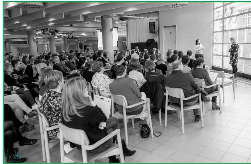
FIOLA DIALOOGDAGEN 2019