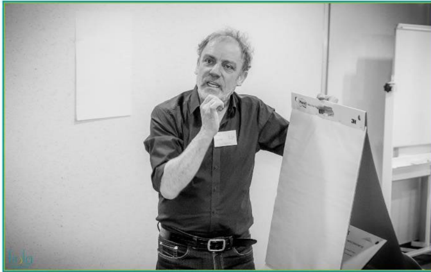
FIOLA DIALOOGDAGEN 2019