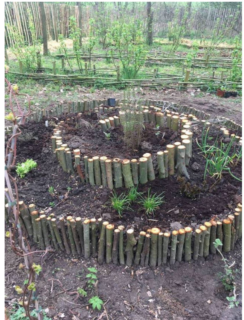
Zuurstof voor Fiola: Dagwerking Braam