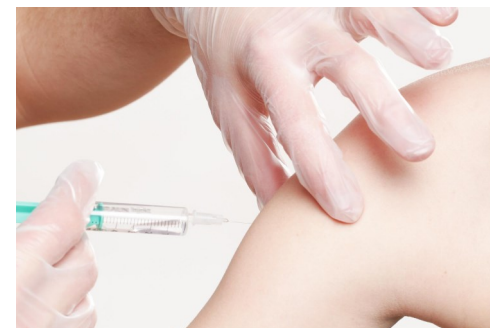
Дуже важливо правильно зробити щеплення не тільки собі, а й оточуючим

Для вакцини проти COVID-19 вас автоматично запрошують до центру шеплення листом, як і решту населення Бельгії.