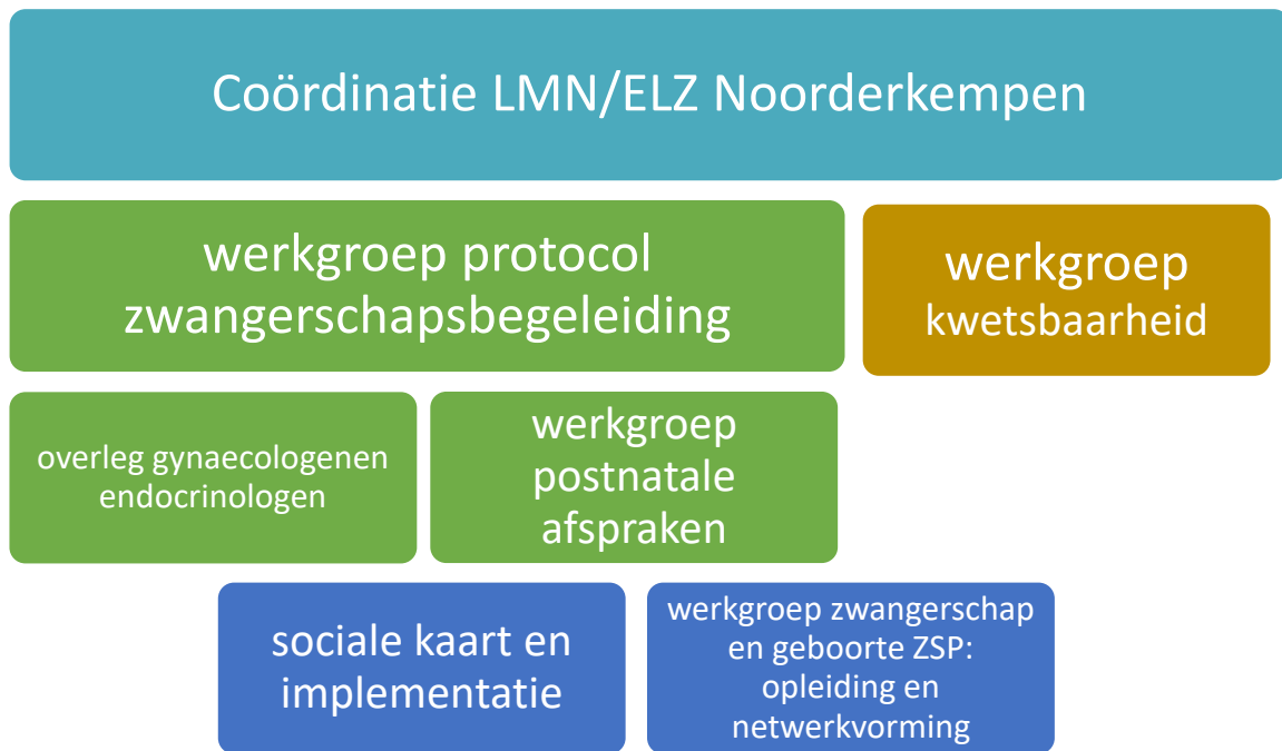
Figuur 1 ZSP: regionaal zorgstrategisch plan 'Samen ZorgKrachtig'

Uit deze doelen vloeiden werkgroepen voort met een heterogene samenstelling.