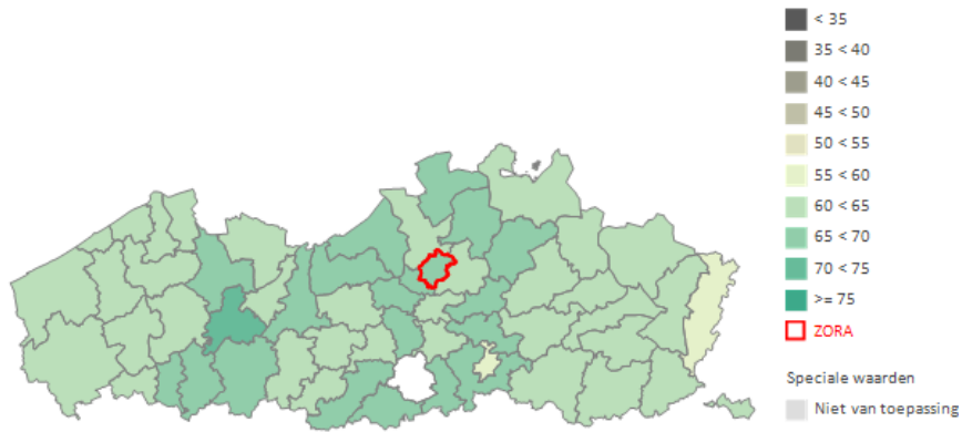
FIGUUR 1: Totale dekingsgraad (%) per ELZ. Vlaams Gewest 2021, 25- 64 jarige vrouwen.